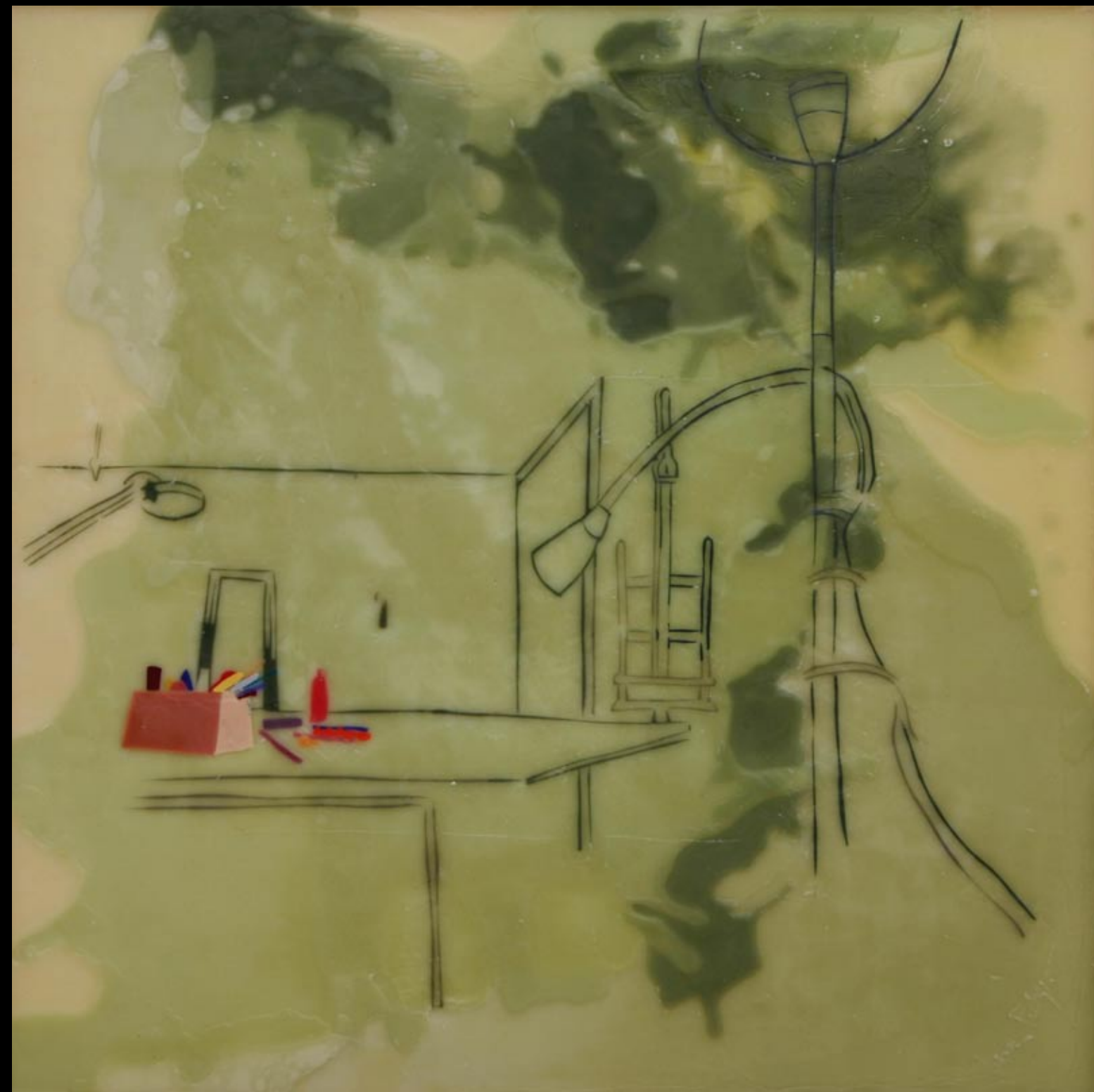
u studiju, 80x80cm, 2007