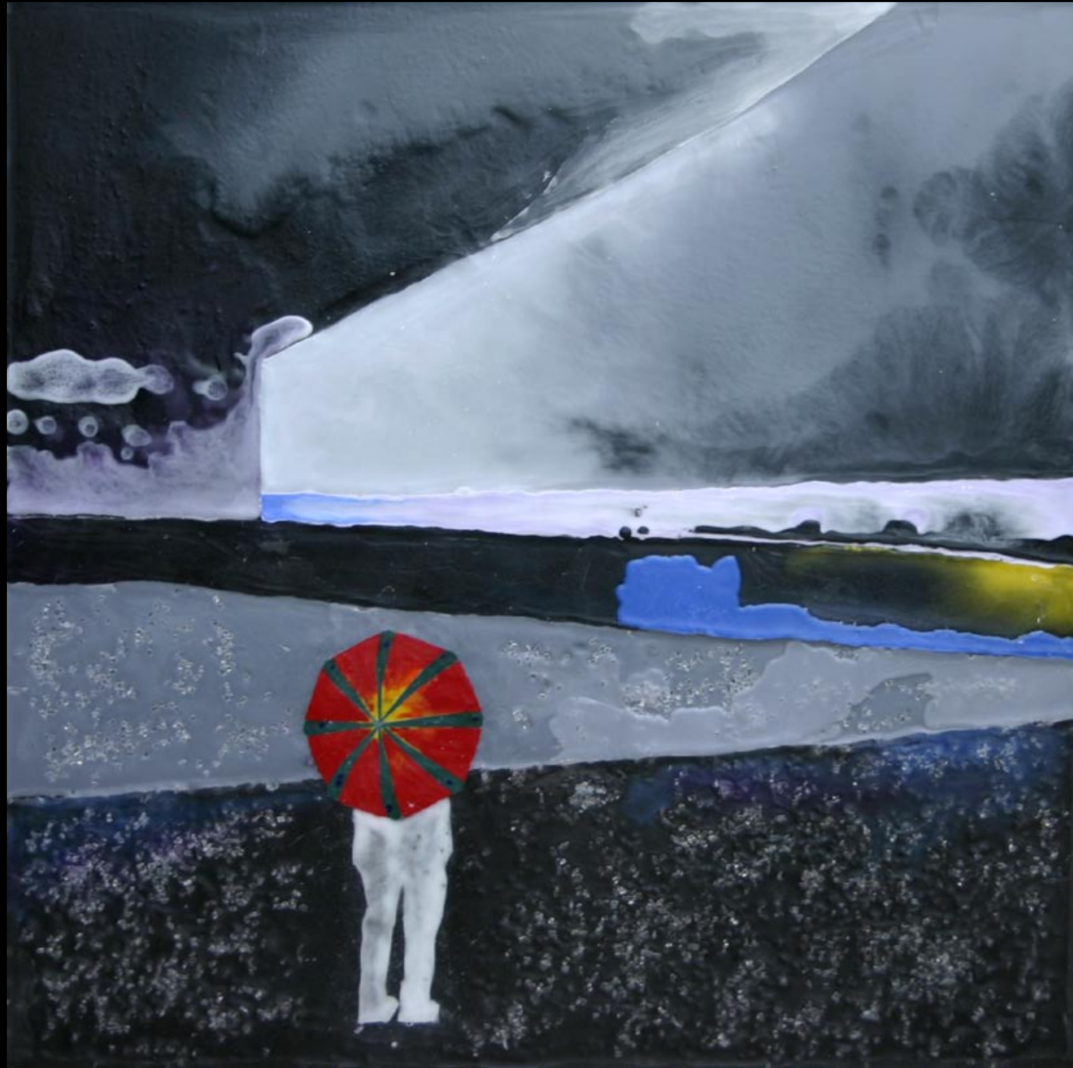
malinconia, 80x80cm, 2008