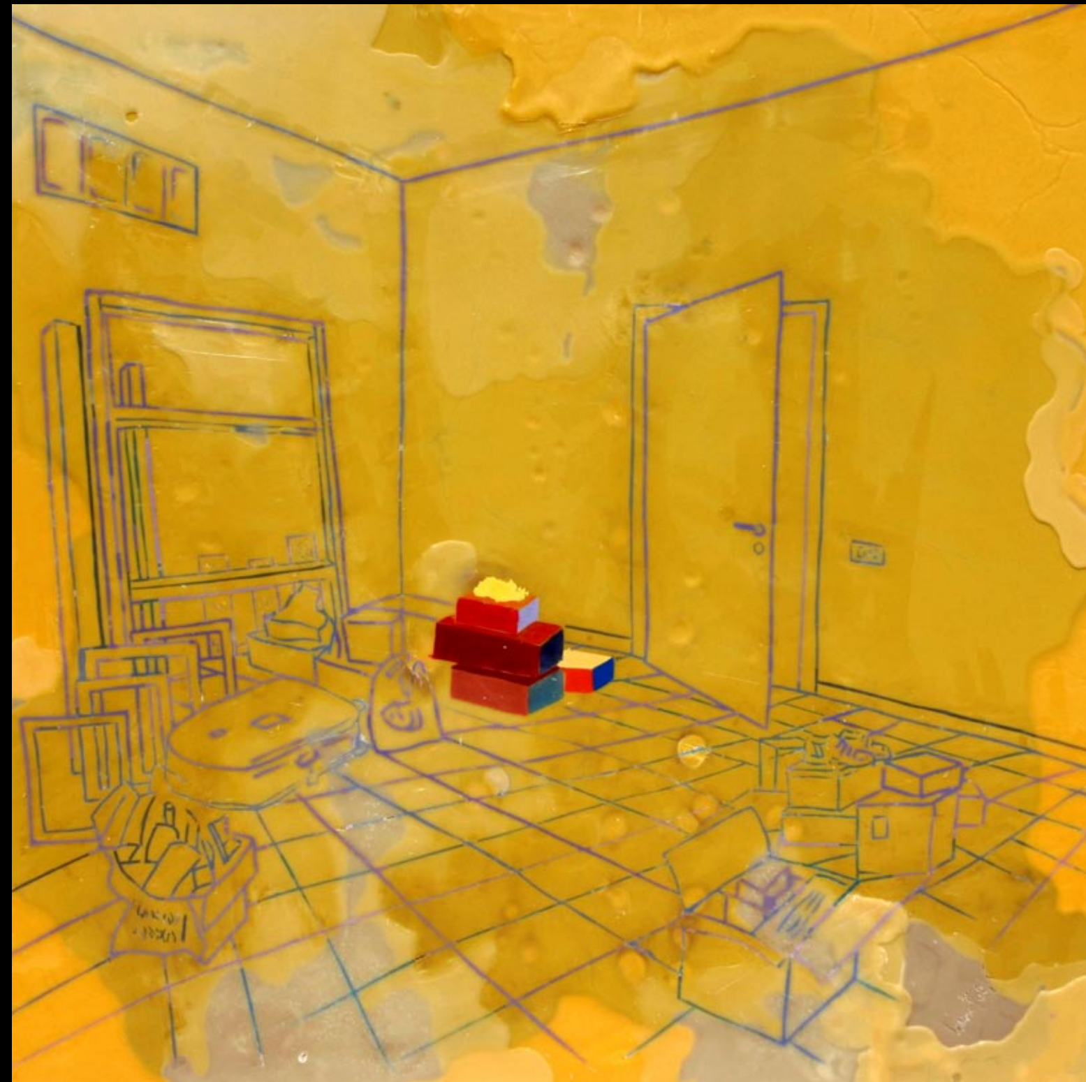
odlazak, 80x80cm, 2007