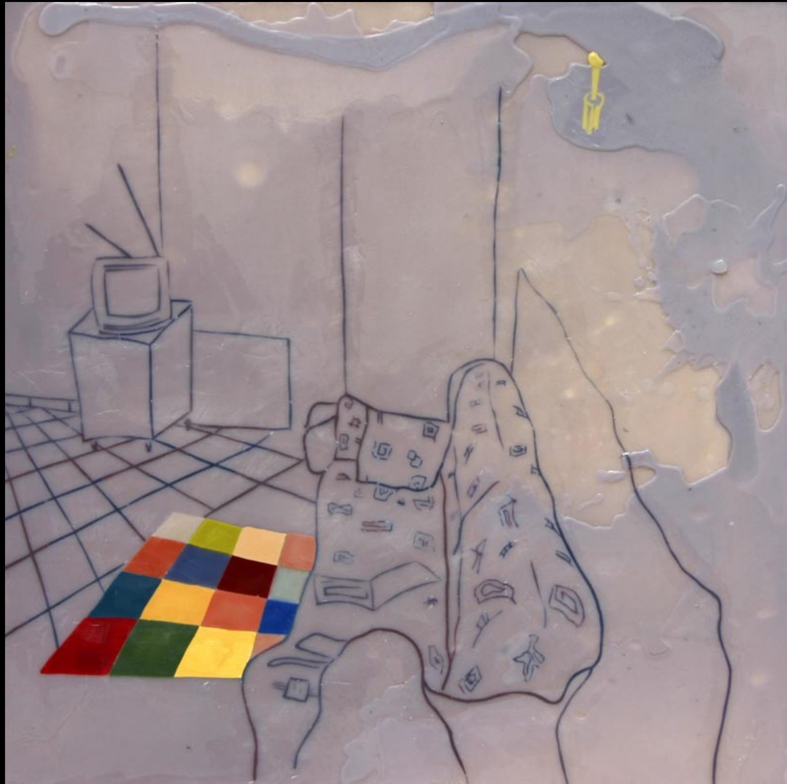
u iščekivanju , 80x80cm, 2007