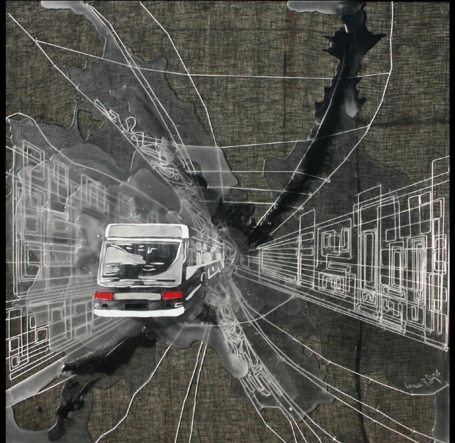
8:44, 80x80cm, 2008