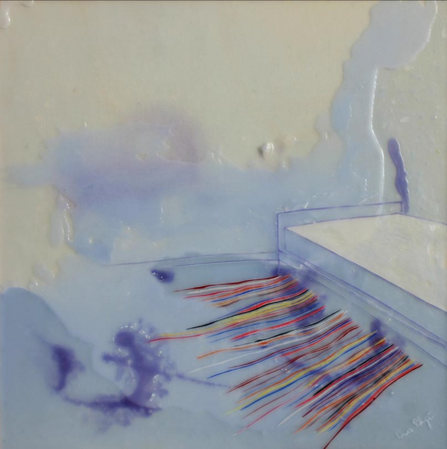
rano djetinjstvo, 80x80cm, 2008