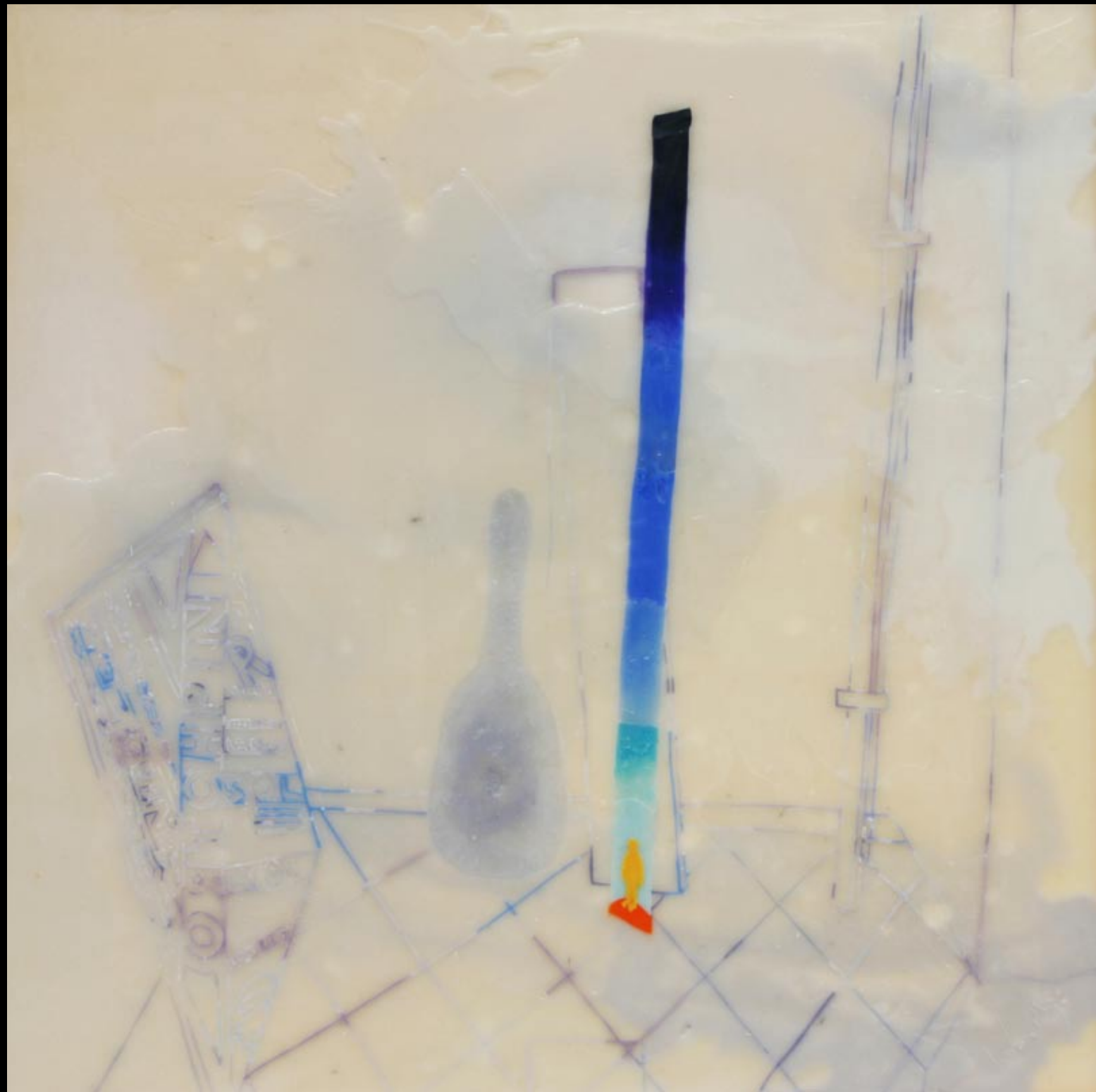
transcedencija, 80x80cm, 2007