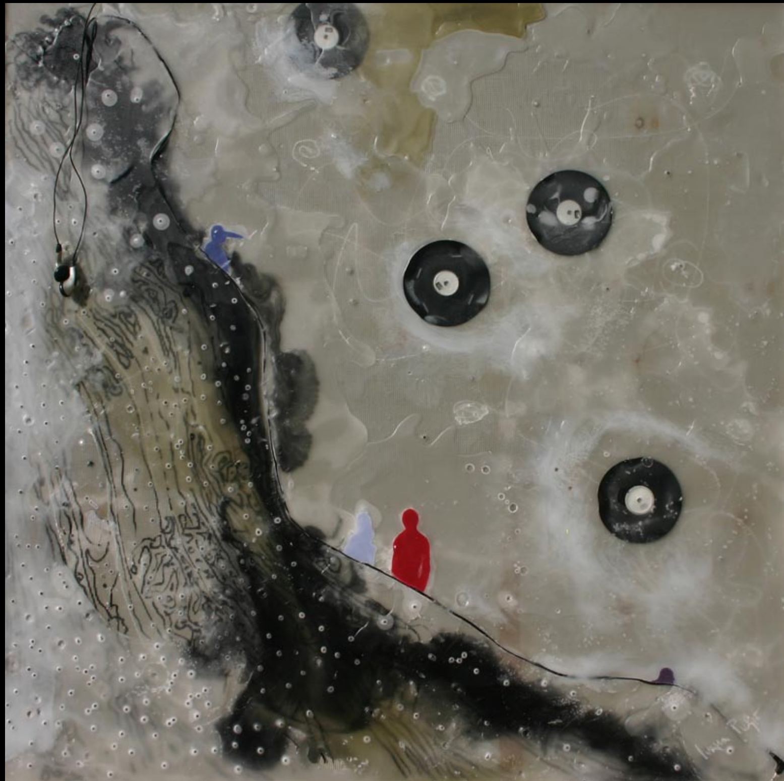
kozmička tišina, 80x80cm, 2008