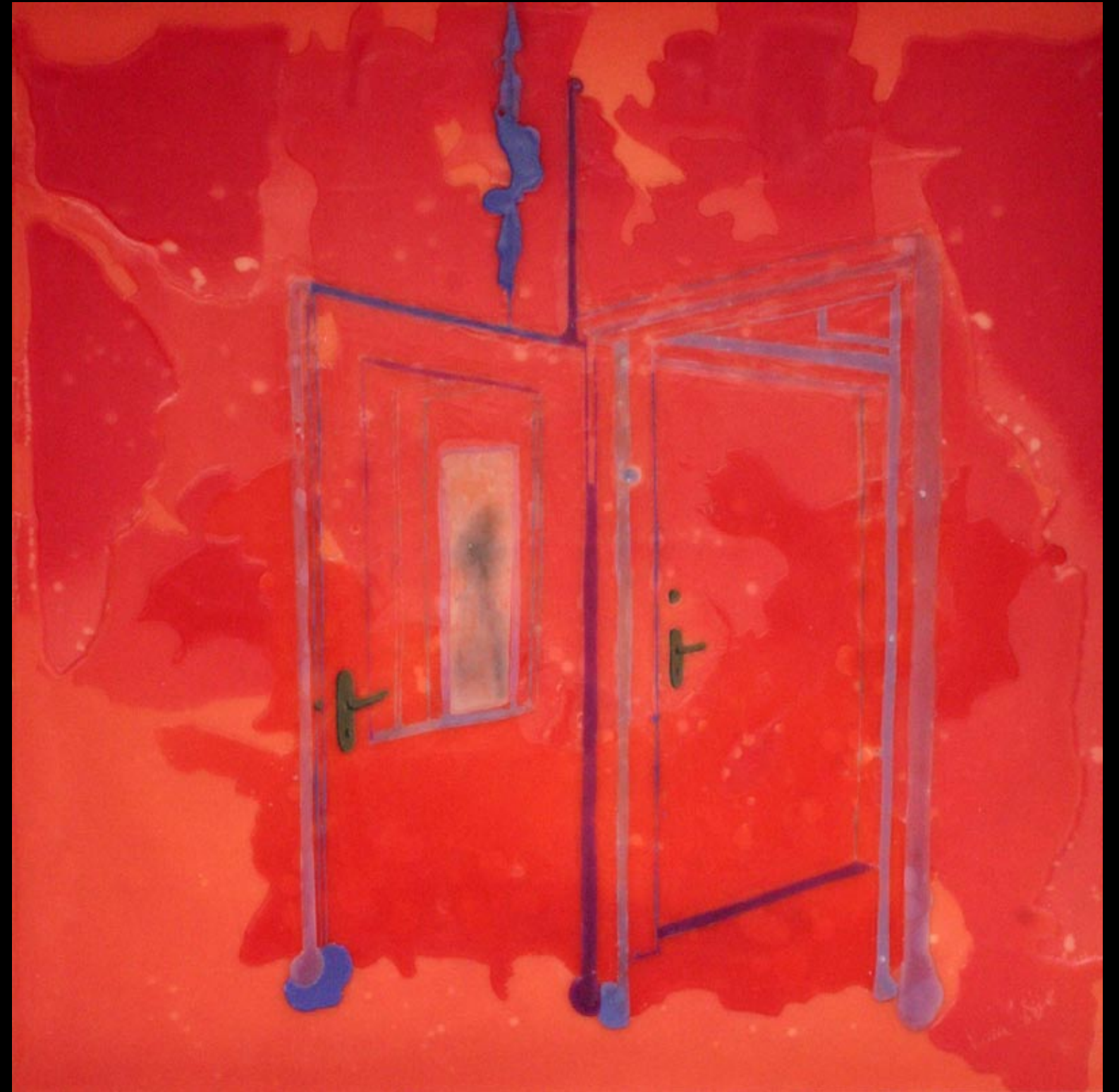
red room, 80x80cm, 2007