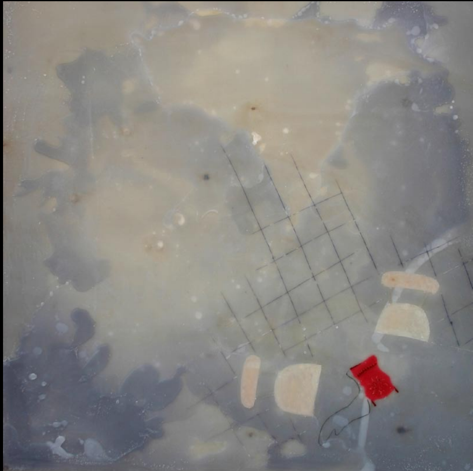
gledano od gore, 80x80cm, 2007