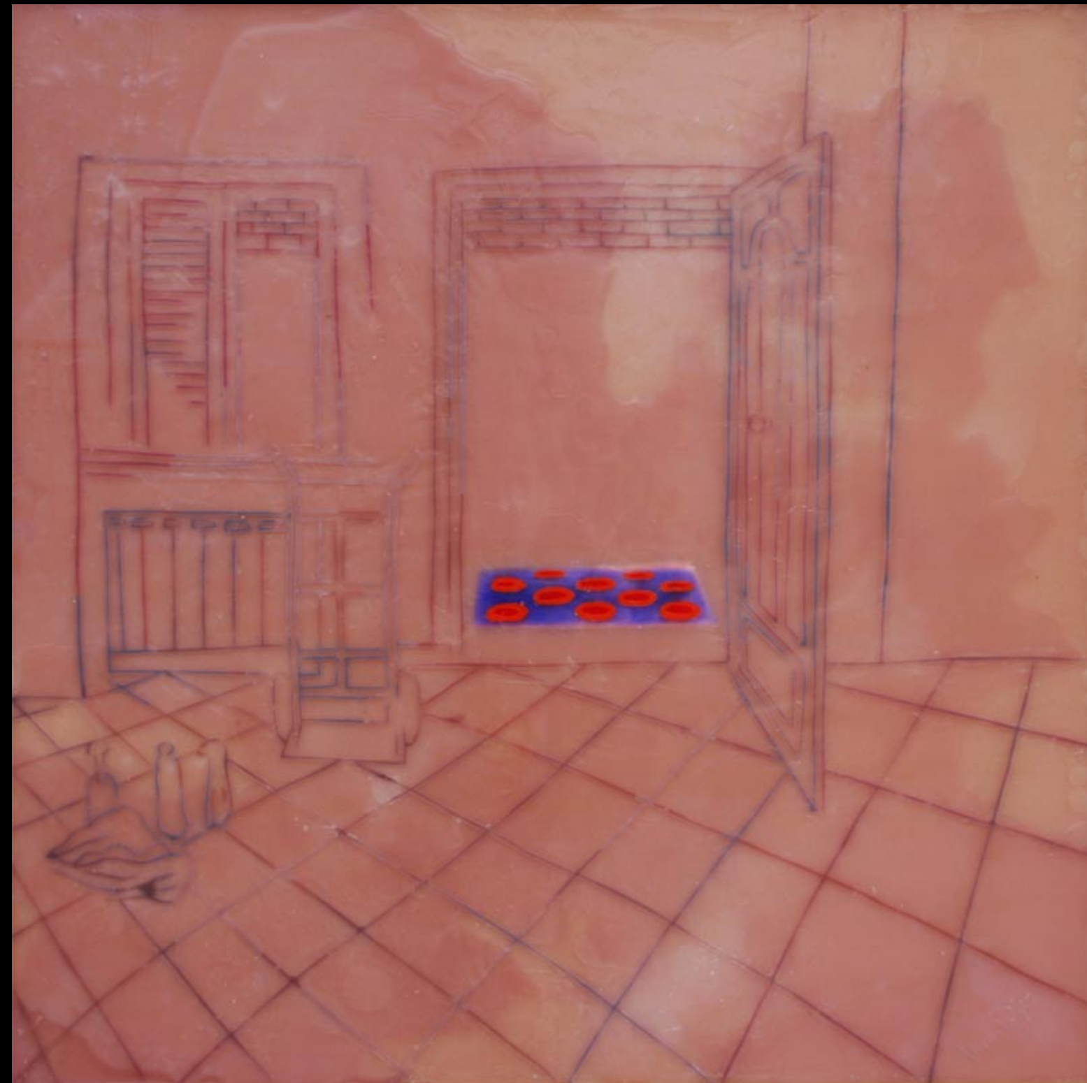
novi prostor, 80x80cm, 2007