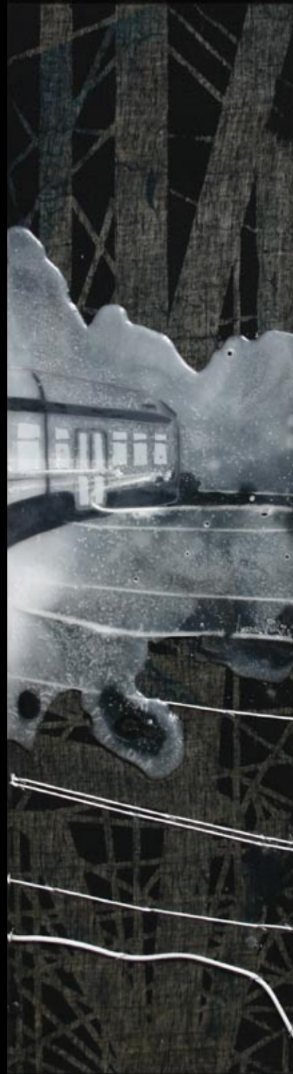
23:05, 84x74cm, 2008