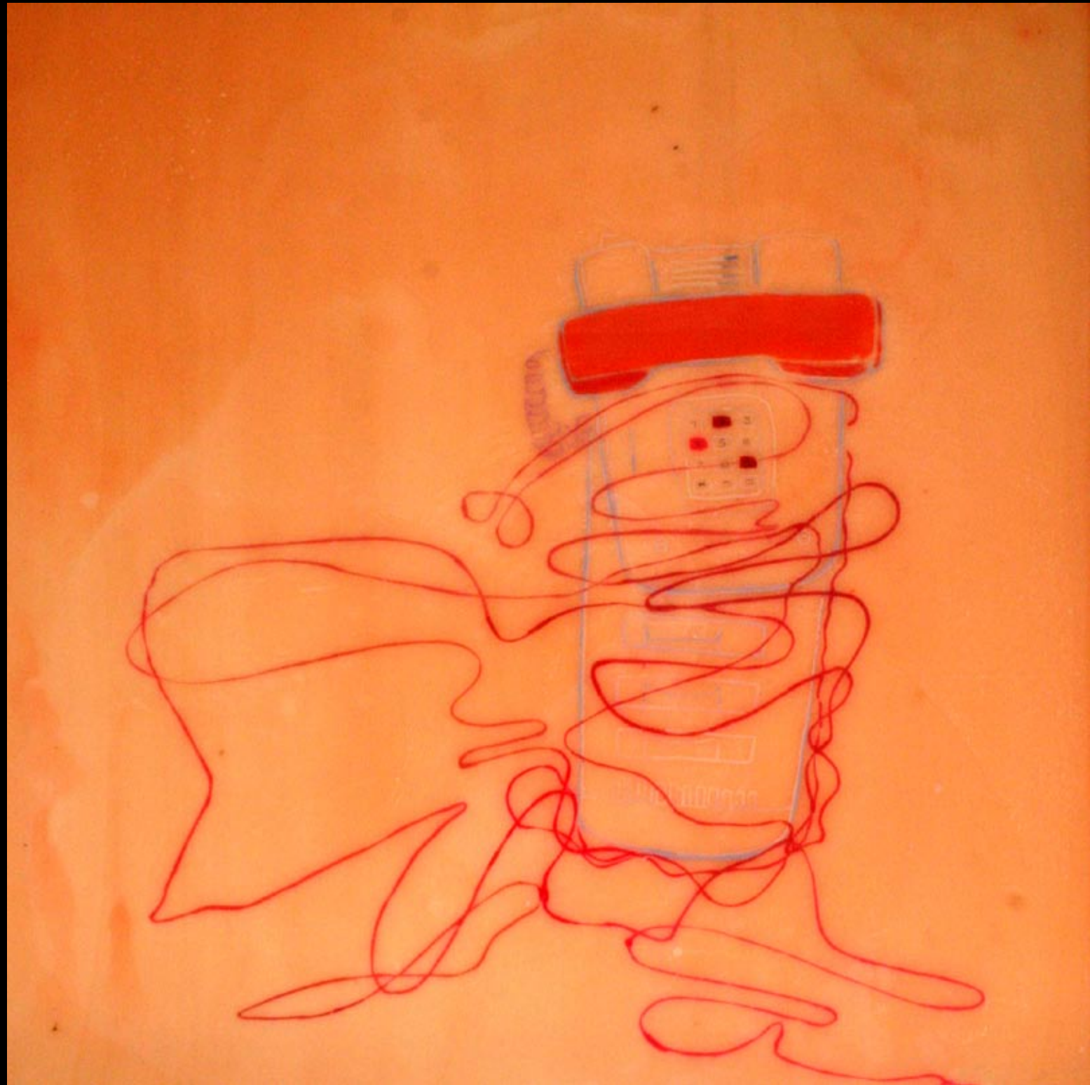
telefon, 80x80cm, 2007