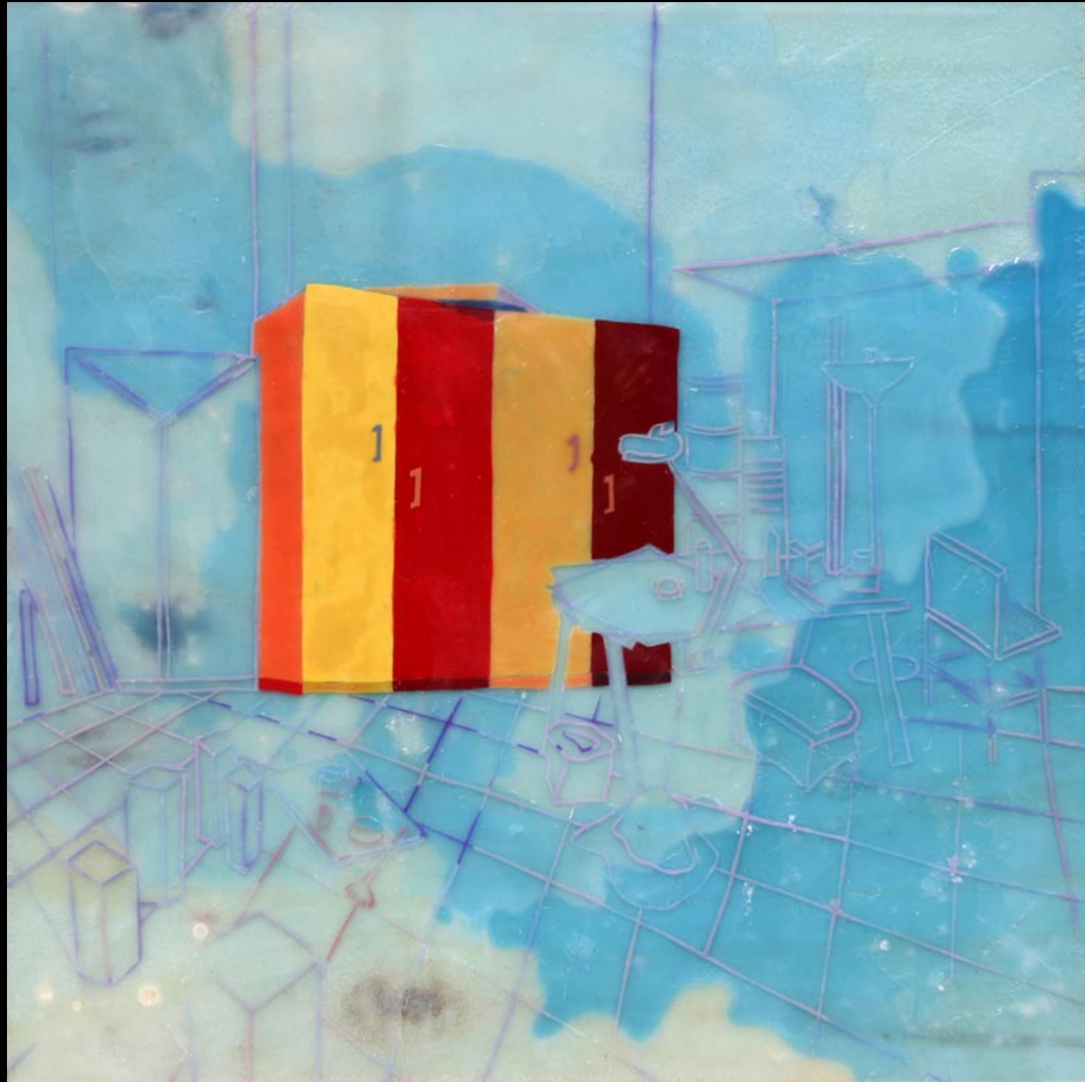
blue room, 80x80cm, 2007