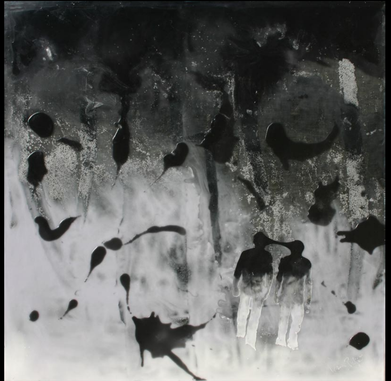
strangers in the night, 80x80cm, 2008